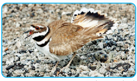
किलडियर ड्रामेबाजी में माहिर

किलडियर मुख्य रूप से उत्तरी, मध्य और दक्षिणी अमेरिका के खुले, घास वाले मैदानों, खेतों, गोल्फ कोर्स और जल निकायों के किनारे पाए जाते हैं। ये कनाडा, संयुक्त राज्य अमेरिका, मैक्सिको और कैरिबियन कंट्रीज में भी बड़ी संख्या में पाए जाते हैं। यह प्लोवर प्रजाति का एक तटीय पक्षी है, जो जमीनी इलाकों में रहता है। जब कोई शिकारी, जैसे- कुत्ता, लोमड़ी या इंसान इसके जमीनी घोंसले के करीब आता है, तो मादा या नर किलडियर घोंसले से दूर जाकर जमीन पर लेट जाता है। यह अपने पंख को इस तरह फैलाता और फड़फड़ाता है, जैसे