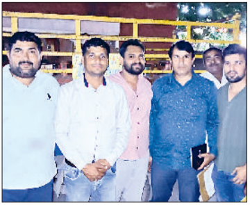
सोनीपत। छापेमारी करने वाली टीम के सदस्य।

जिले में कमर्शियल गैस आपूर्ति बंद होने को करीब एक माह बीतने को है। कमर्शियल सिलेंडरों के अभाव में अब कारोबार में घरेलू सिलेंडरों का प्रयोग घटने से होने लगा है। दुकानों ही नहीं, होटल, रेस्तरां, ढाबों से लेकर दुकानों व खाद्य पदार्थ के स्टॉलों पर घरेलू सिलेंडर प्रयोग होने लगे हैं। ऐसे में खाद्य एवं आपूर्ति विभाग की ओर से गठित टीम ने विभिन्न स्थानों पर छापा मारकर 24 घंटे के अंदर 35 सिलेंडर जब्त किए हैं। अधिकारियों की मानें तो विभाग की टीम अब तक छापामार कार्रवाई के दौरान 121 घरेलू सिलेंडर, कमर्शियल स्टॉक व छोटे सिलेंडरों को जब्त कर चुकी है। खाद्य एवं आपूर्ति विभाग की टीम ने वीरवार को सोनीपत के सेक्टर-14, दिल्ली रोड, आईटीआई चौक सहित बहालगढ़,