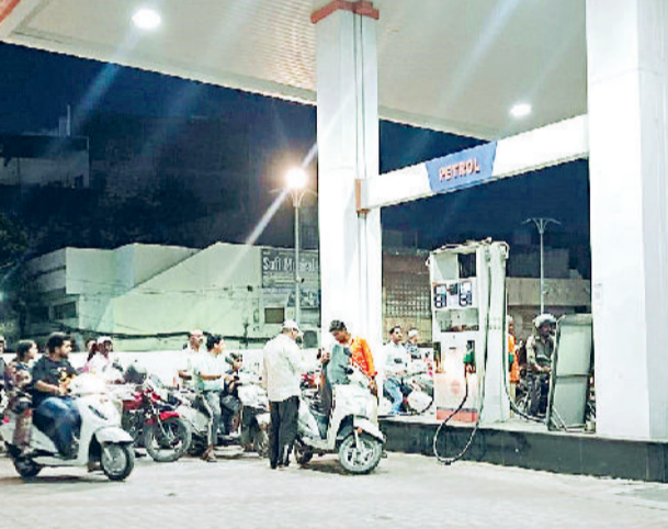
सोनीपत। ओल्ड डीसी रोड स्थित पंप पर पेट्रोल भरवाने के लिए लगी वाहन चालकों की भीड़।

पश्चिम एशिया में युद्ध के चलते कमर्शियल गैस की किल्लत के बाद अब प्राइवेट तेल कंपनियों पेट्रोल व डीजल के दामों में इजाफा करने लगी है। अंतरराष्ट्रीय बाजार में कच्चे तेल की कीमतों में वृद्धि के कारण यह कदम उठाया जा रहा है। हालांकि सरकारी कंपनियों की ओर से पेट्रोल व डीजल के दाम स्थिर हैं। इसके बीच जिले में पेट्रोल की सप्लाई प्रभावित होने से अधिकतर पंपों पर ड्राई होने की स्थिति में पहुंचने लगे हैं। एक सप्ताह पहले प्रीमियम पेट्रोल की कीमत में 2.63 रुपये प्रति लीटर का इजाफा होने के बाद वीरवार को नायरा एनर्जी कंपनी ने पेट्रोल के दाम में 5 रुपये व डीजल के दाम में 3 रुपये की बढ़ोतरी की है। इससे वाहन चालकों में हलचल का दौर शुरू हो गया है। वाहनों में पेट्रोल भरवाने के लिए वाहन चालक पंपों पर भीड़ लगाने लगे हैं। जिले में इंडियन ऑयल, हिंदुस्तान पेट्रोलियम, भारत पेट्रोलियम व जियो-बीपी के करीब 100 से ज्यादा पेट्रोल पंपों का संचालन हो रहा है। हालांकि नायरा एनर्जी कंपनी के अंतर्गत सोनीपत में केवल दो पेट्रोल पंपों का ही संचालन हो रहा है। ऐसे में कंपनी के रेट बढ़ाने से कोई खास असर नहीं पड़ेगा।