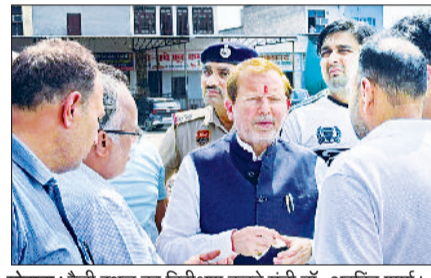
गोहाना। रैली स्थल का निरीक्षण करते मंत्री डॉ. अरविंद शर्मा।

हरिभूमि न्यूज ▶▶ गोहाना गोहाना विधानसभा क्षेत्र में 29 मार्च को आयोजित होने वाली धन्यवाद एवं विकास रैली को लेकर तैयारियां जोर-शोर से चल रही हैं। इसी कड़ी में सहकारिता मंत्री कैबिनेट मंत्री डॉ. अरविंद शर्मा ने नई सब्जी मंडी पर निरीक्षण किया एवं रैली संयोजक डॉ. अरविंद शर्मा ने नई सब्जी मंडी पहुंचकर रैली स्थल का विस्तृत निरीक्षण किया और व्यवस्थाओं का जायजा लिया। इसके बाद मंत्री गांव गढ़ी उजाले खां में ग्रामीणों से जनसंवाद किया। मंत्री डॉ. अरविंद शर्मा ने कहा कि गोहाना की जागरूक और मेहनती जनता ने भाजपा को लगातार तीसरी बार प्रदेश में सरकार बनाने का अवसर दिया है। प्रदेश की जनता के विश्वास और समर्थन के चलते ही नायब सिंह सैनी को दूसरी बार मुख्यमंत्री बनने का गौरव प्राप्त हुआ है। यह रैली गोहाना के विकास में एक महत्वपूर्ण कदम साबित होगी। रैली में मुख्यमंत्री