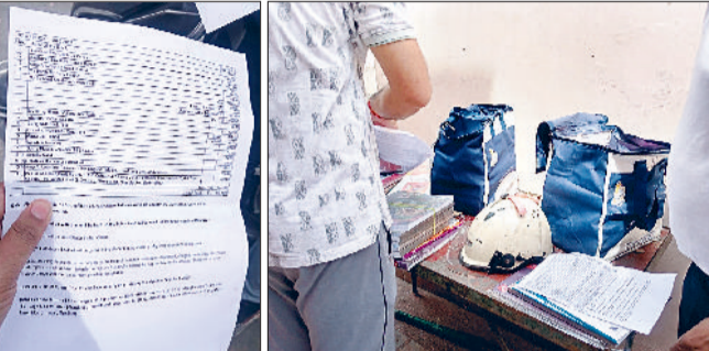
सोनीपत। निजी स्कूल की कक्षा दूसरी की किताबों की लिस्ट, दुकान के बाहर लिस्ट अनुसार निजी प्रकाशकों की पुस्तकों का मिलान करते अभिभावक।

पिछले साल के अपेक्षा करीब 10 प्रतिशत बड़े किताबों के दाम, खरीदारी को लेकर अभिभावकों की दौड़ धूप शुरू निजी स्कूलों के हस्तक्षेप से बाहर चल रही दुकानें, पुस्तक विक्रेताओं को भी कमीशन का लालच