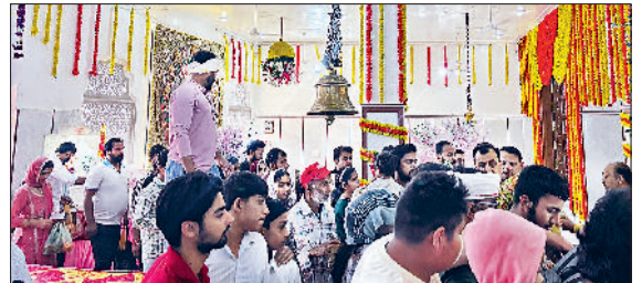
गोहाना। मंदिर में पूजा-अर्चना करने पहुंचे श्रद्धालु।