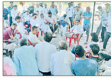
सोनीपत। गांव में बैठक करते ग्रामीण।

है। इसको लेकर ग्रामीणों के एक प्रतिनिधिमंडल की जल्द मुख्यमंत्री से मुलाकात कराई जाएगी।