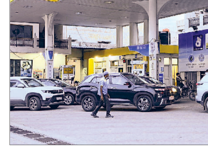
सोनीपत। एटलस रोड स्थित पंप पर वाहनों की लाइनें।