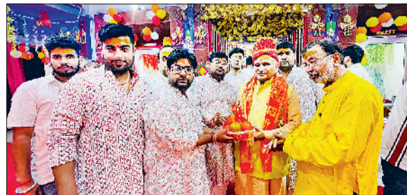
गोहाना। गुरुवार को चक्रवर्ती सम्राट अशोक को उनकी जयंती पर याद किया गया।